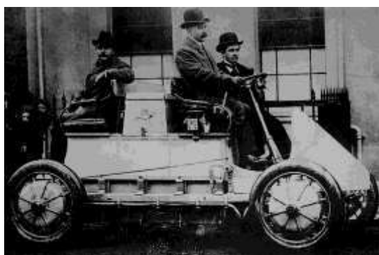
図3 4輪駆動4人乗り電気自動車 （ローナーポルシェ”Toujours Contente”）（1900）