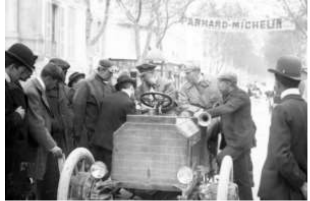
図 9 メルセデスシンプレックス(1902)

同社の最初のハイブリッド車と紹介している。名称はメルセデスシンプレックスと呼んでいる (11) 。