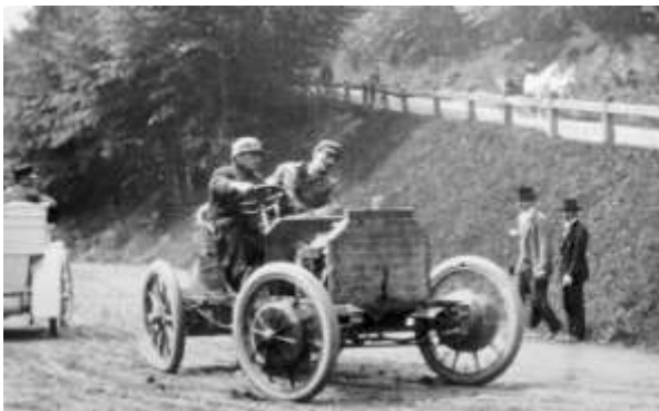
図 8 ミクステ出場のレース

以上のような改良をした車で 1902 年 4 月のエクセルバーク山の登頂レースに出場した。4.2km のダートの登攀レースで大型車クラスで優勝したという。