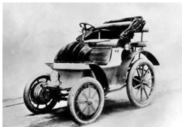
図 2 2 輪駆動電気自動車 (ローナーポルシェ) (1898)

なお、この車はウィーンの産業技術博物館 (Technisches Museum Wien) に実車が展示されている。同所の展示説明ではウィーンの消防局が購入し、さらにタクシーにも使われたと述べられている。しかし、実用化されたのはその後のローナーポルシェのハイブリッド車だと思われる。