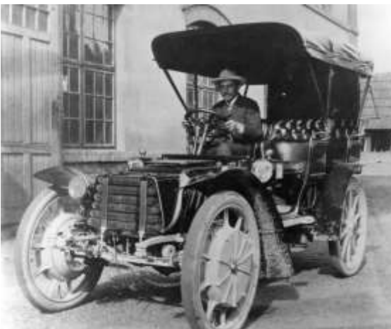
図5 ローナーポルシェミクステ市販車(1903)

この車の最初の 5 台はシュツットガルトのダイムラー社に 1 台 14,000 クローネで納入された。しかし、結局ダイムラーのエンジンを搭載したミクステはローナー社では 7 台しか製造されなかった。1903 年以降、フランス製のエンジン (Panhard & Levassor 社製) が採用された。P&L 社が英仏独でのライセンスをローナー社から取得したことによる。