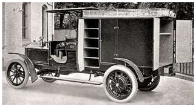
図 10 ダイムラー社 食品運搬車 (1908)