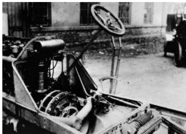
図 1 1 メルセデスマイクステの発電機