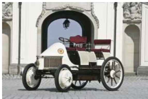
図 1 2 ポルシェ社の復刻した Semper Vivus

イズは全長 3,390×全幅 1,880×全高 1,850mm であり、ホイールベースは 2,310mm である。その他は表 3 に示した仕様と同一である。