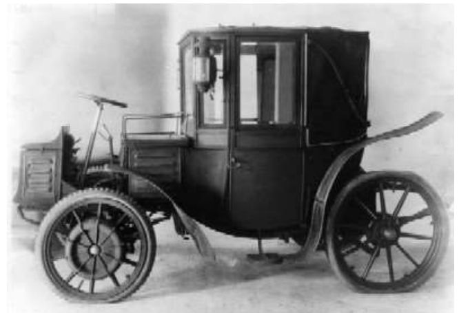
図7 屋根付きローナーポルシェミクステ(1903)